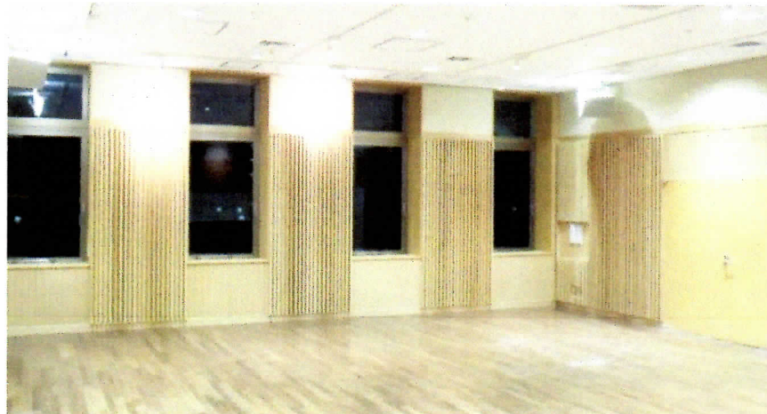
「多目的室」(新区庁舎2階)

新庁舎には「多目的室(定員:100席程度)」及び「リハーサル室」を整備し、平成28年4月1日に開館予定です。4月からの利用(仮)予約は1月4日から受付開始します。詳しくは 金沢公会堂 (045-788-7890)にお問合せください。